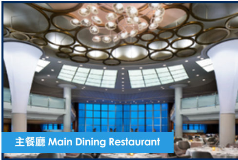
主餐廳 Main Dining Restaurant