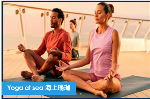
Yoga at sea 海上瑜珈