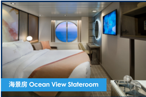
海景房 Ocean View Stateroom