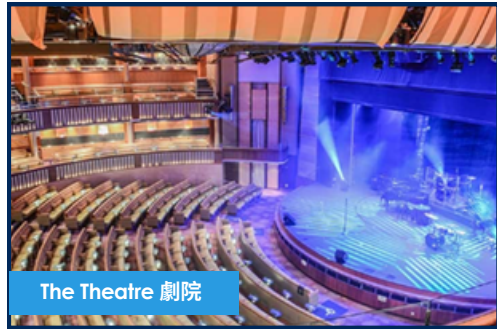
The Theatre 劇院