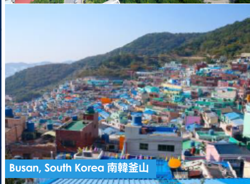
Busan, South Korea 南韓釜山