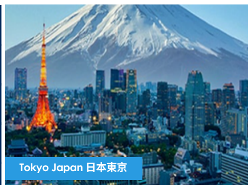
Tokyo Japan 日本東京