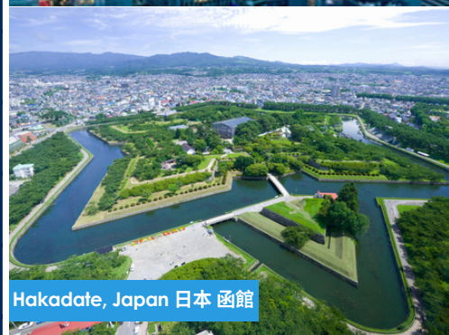
Hakodate, Japan 日本 函館